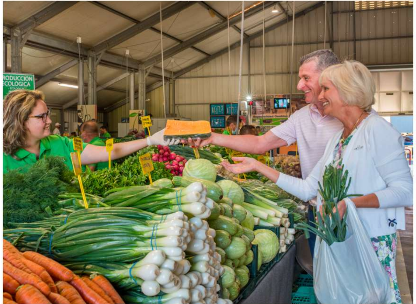
Mercado del Agricultor.

Cebollas, zanahorias, papayas, puerros, pimientos, naranjas, tomates, mermeladas, panes... Todo ello, se va colocando con mimo en los diferentes puestos de venta.