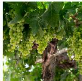
"Verde que te quiero verde. Y si me lo das blanco y afrutado, mil veces más te querré".

Final del trayecto. Sin duda, este día merece un brindis.