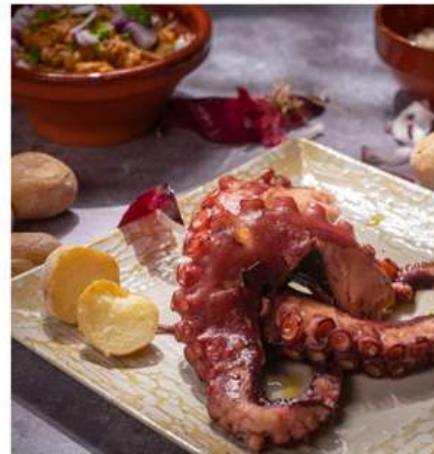
Rejo de pulpo guisado.