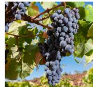
"Roja tienes el alma y tintos los sentimientos".

"El rojo de la sangre y el blanco de tus lágrimas"