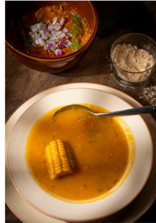
Potaje de verduras.

Porque esta también es una manera de conocernos un poco más.