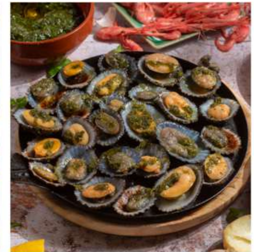
Lapas con mojo.