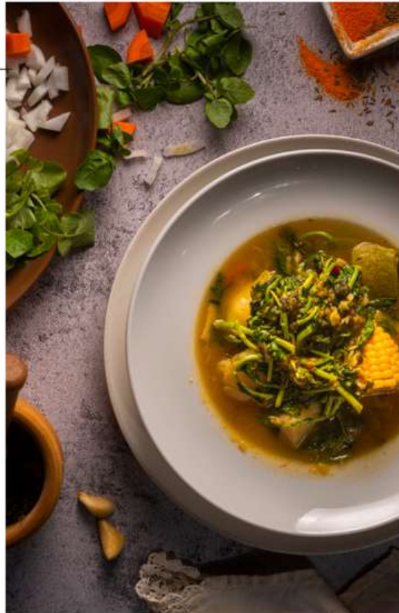
Potaje de berros.

"La piña de millo, protagonista absoluta".