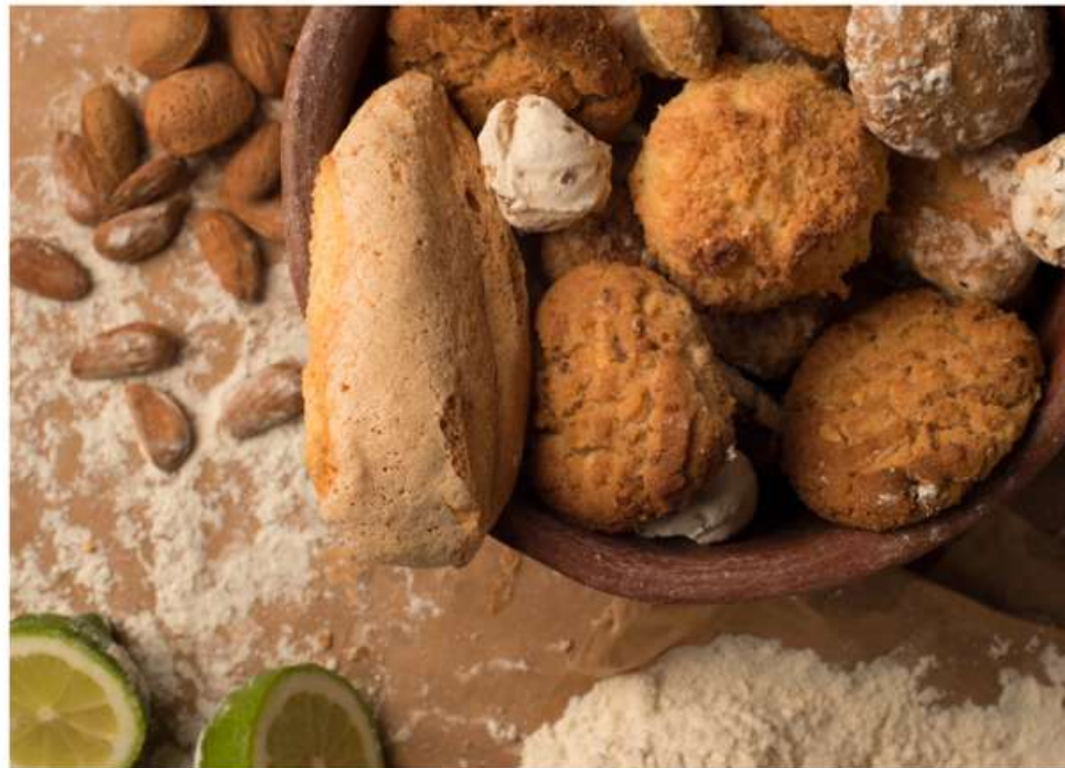
Mimos, tortas de almendra, biscochos...

"Batió las claras a punto de nieve y, cual cascada, dejó caer el azúcar".